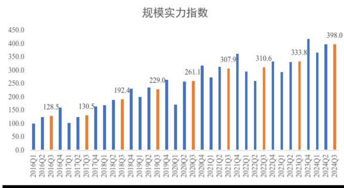
图 2 2016 年-2024 年三季度规模实力指数

三季度，规模实力指数为 398.0，同比提升 19.2%。快递业积极服务消费品以旧换新，保障毕业、开学季寄递需求，支撑七夕、中秋等节假日线上促销，市场规模较快拓展。三季度，快递业务量共完成 11.88 亿件，同比增长 22.9%，高于全国增速 2.8 个百分点，日均业务量近 1300 万件。其中，异地快递业务量完成 8.9 亿件，同比增长 25.4%，高于全国增速 5 个百分点，表明上海市跨区域商品流动活力有所增强。快递业务收入共完成 591.1 亿元，同比增长 17.7%，高于全国增速 6.5 个百分点，在全国快递业务收入中的占比达 17.2%，较去年同期提升 0.9 个百分点，总部集聚效益稳步显现，为提升全行业收入水平发挥引领作用。三季度，上海市快递业劳动生产率水平同比提升 17.4 个百分点。一方面，政府企业协会多次组织开展“夏日送清凉”活动，制定多项关心关爱措施，确保一线从业人员安全度夏，保障行业高效运行。另一方面，快递企业紧抓政策利好机遇，加大网点无人车投放力度，探索无人机在区域运输、末端配送等场景商业应用，以科技赋能行业发展，提升行业整体运行效率。