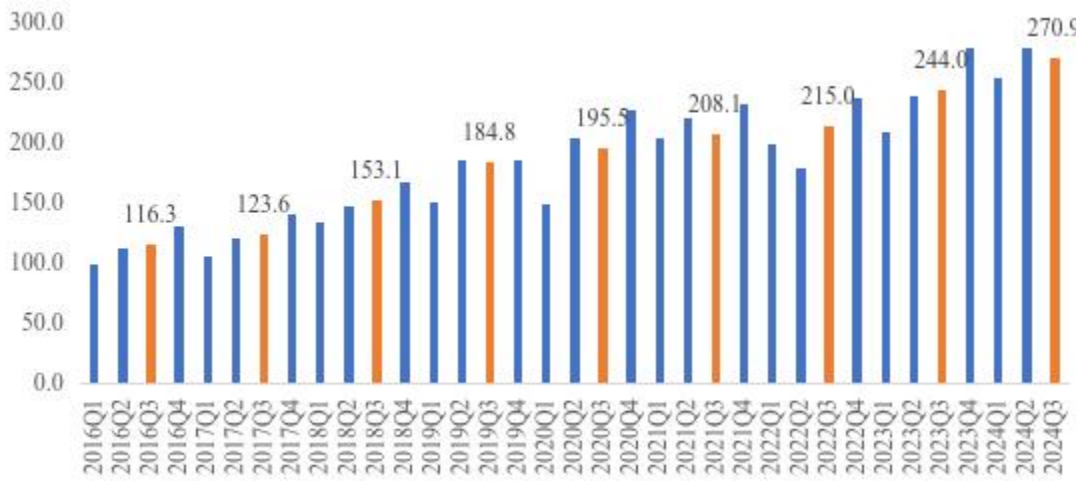
图 1 2016 年-2024 年三季度上海快递发展指数

三季度，上海快递发展指数为 270.9，同比提升 11.0%。其中，规模实力指数、服务质效指数、价值贡献指数和开放集聚指数分别为 398.0、291.4、225.1 和 169.4，同比分别提升 19.2%、8.0%、5.5%和 5.5%。上海市快递业发展稳中有进，市场规模保持较快增长，服务质效持续改善，跨境服务能力稳步提升，有力支撑线上经济与实体经济协同发展，为上海市经济回升向好提供基础保障。