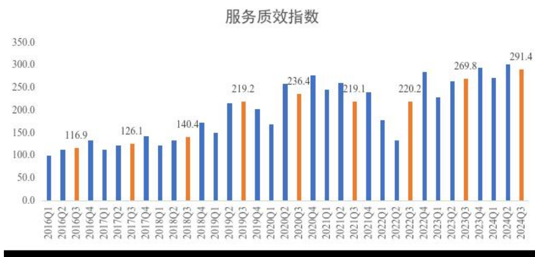
图 3 2016 年-2024 年三季度服务质效指数

三季度，服务质效指数为 291.4，同比提升 8.0%。上海市邮政管理局贯彻落实“政策精准直达、服务便利获取、诉求高效办理”的“服务包”制度，持续优化营商环境，帮助重点企业化解场所、配送难题，通过政策赋能，助力企业提升服务质效。 一是末端服务优化升级。 上海快递企业通过提高送件补贴、加派配送人员、延长驿站夜间取件时长等方式，提升末端服务质量，更好满足消费者多样化、多时段收货需求，用户体验改善明显，快递服务公众满意度同比提升 3.3 分。 二是运营模式创新发展。 上海快递企业针对中心城区场地租赁难题，积极推动市内运营集约化、共享化发展，通过创新多网点集中中转模式，实现场地共用、集中分拣、末端共享，提升末端资源使用效率。 三是基础设施智能改造。 上海快递企业深入落实《上海市推动大规模设备更新和消费品以旧换新行动计划（2024-2027）年》，加快推动分拨中心、末端网点设备设施以旧换新与升级改造，扩大新质生产力应用范围，提升运行数智化水平，服务保障能力持续增强，日均服务人次超 2700 万，同比提升 24.4%。