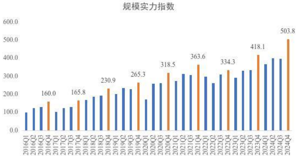
图 2 2016 年-2024 年四季度规模实力指数

四季度，服务质效指数为 327.5，同比提升 11.0%。行业高质量发展迈出坚实步伐。一是持续改善服务质量。旺季期间，快递企业通过加大场地、运力、人力投入，科学调控揽收节奏，均衡提升揽派进度，优化快递服务流程，提高末端配送效率，加强客户服务管理等措施，有效保障快递服务质量，努力打造“畅通、安全、暖心”旺季。快递服务公众满意度同比提升 1.1 分，季度内日均服务人次超 3400 万，同比提升 28.5%。二是注重科技应用赋能。快递企业成立空地一体物流装备智能运营创新实验室，积极探索低空经济应用新场景，加速布局无人设备设施，数字化和智能化技术深度覆盖收转运派环节，有效纾解快递末端服务难题，促进快递服务质效大幅提升。三是有效聚合各方资源。持续推动邮快商合作、降低农村运输投递成本。青浦区积极开展“邮快供合作”，有效发挥供销社点多面广的资源优势，促进形成寄递企业降本增效、供销社营收增加的双赢格局。