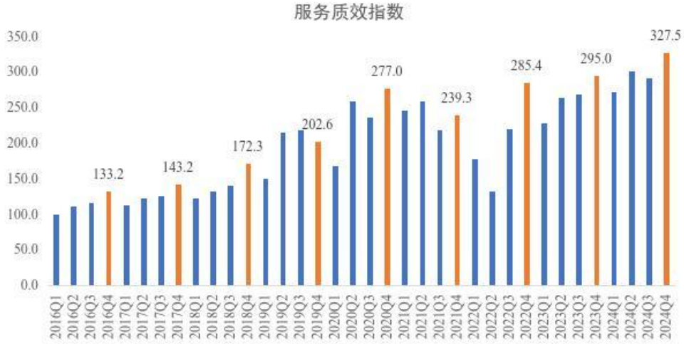
图 3 2016 年-2024 年四季度服务质效指数

四季度，价值贡献指数为 215.6。行业积极落实促消费、扩内需和“以旧换新”补贴等多项利好政策，为支撑线上消费与实体经济互促发展作出积极贡献。一是赋能释放消费潜力。快递企业高质量满足国庆及“双 11”等大促期间的寄递需求，助力“2024 上海网络购物季暨电商平台上海专区优惠活动”“11 直播月”“丝路云品”电商周等主题促销活动顺利开展，服务上海市商品类网络购物交易额达 2607.1 亿元，同比提升 5.3%。二是深化产业融合发展。通过推动城乡商贸流通融合发展、建设生活必需品流通保供体系、完善农村商贸流通体系，全力推进本市邮政快递业实现“现代供应链企业与产业跨界融合”，7 个邮政快递业项目成功入选上海市现代商贸流通体系试点专项资金拟支持项目，产业链供应链服务能力不断增强。