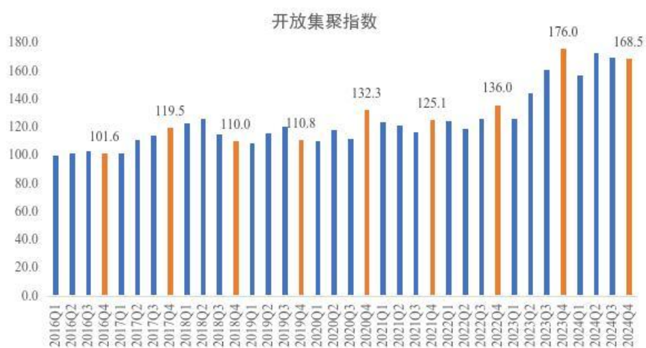
图 5 2016 年-2024 年四季度开放集聚指数

许可试点，助力打造新时代国际开放门户枢纽新标杆。快递企业联合上海跨境电子商务公共服务平台共建上海与“丝路电商”伙伴国之间合规数据共享通道，有效提高双边口岸通关便利化水平，助力上海市“丝路电商”合作先行区创建。