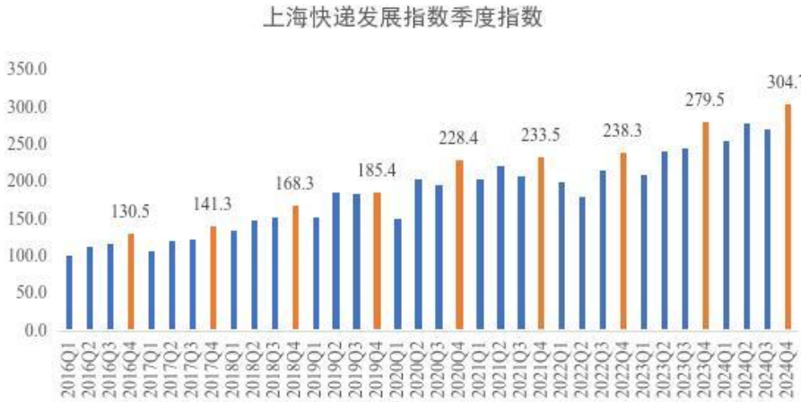
图 1 2016 年-2024 年四季度上海快递发展指数

四季度，上海快递发展指数为 304.7，同比提升 9.0%。其中，规模实力指数、服务质效指数分别为 503.8 和 327.5，同比分别增长 20.5% 和 11.0%，价值贡献指数和开放集聚指数分别为 215.6 和 168.5。四季度，上海市快递市场规模持续扩大，服务能力稳步增强，发展质效明显提升，跨境服务动能持续释放，科技应用场景不断丰富，有力促进上海市线上消费繁荣活跃、区域产品加快流通，有效支撑上海市新动能新产业不断壮大。